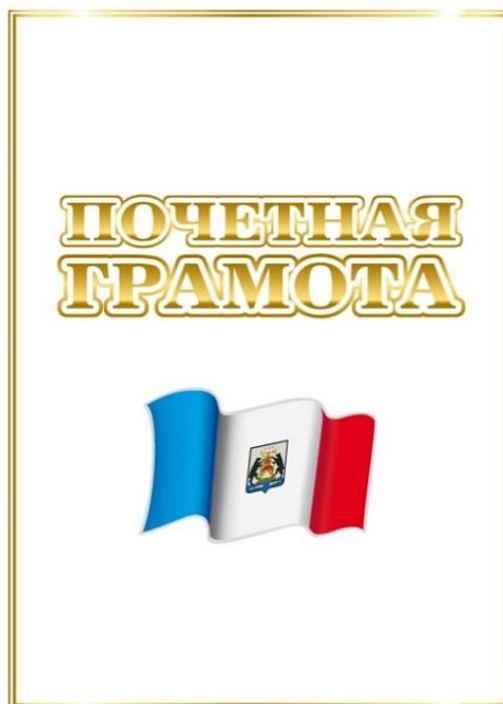
Рисунок 2. Разворот Почетной грамоты Правительства Новгородской области